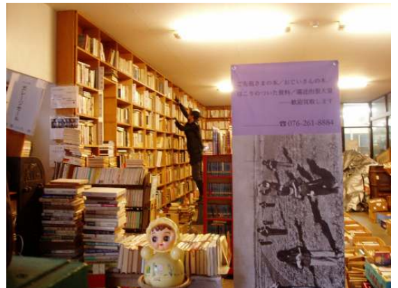
金沢文圃閣 ガレージ店 店内