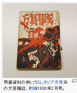
所蔵資料の例: プロレタリア文学系の文芸雑誌、戦旗1930年2月号。