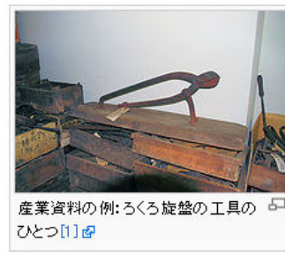
産業資料の例: ろくろ旋盤の工具のひとつ