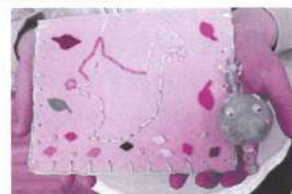
すてきな作品に仕上がりました

◆2月21日(土)、はくぶつかんクラブ「北の動物ししゅうのティッシュケース」（講師：石原生久代解説員）を開催しました。