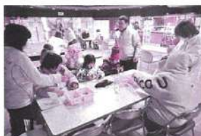
大盛況のマグネットづくり

◆2月11日(水・祝)、「第36回北方民族博物館開館記念感謝DAY」が催されました。恒例となっているおしるこの無料配布やオリジナルマグネットづくり、かんじき体験を今年も実施しました。