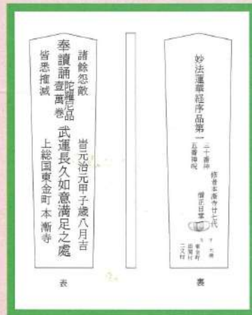
北清島町遺跡出土の木札