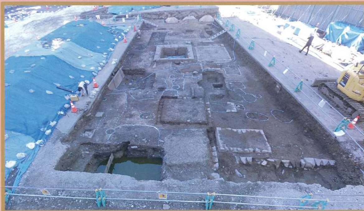
北稲荷町遺跡（旧下谷小学校跡地地点）から見つかった大名墓群

今年度は、北稲荷町遺跡（旧下谷小学校跡地地点）の発掘調査を行いました。 とても大きな大名墓と呼ばれるお墓がたくさん見つかりました。