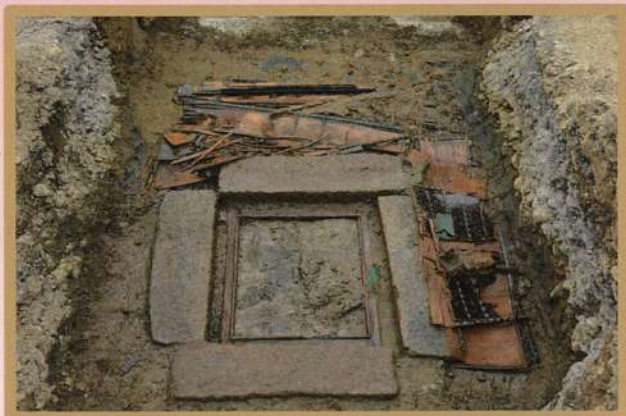
22号遺構から見つかった石槨と駕籠