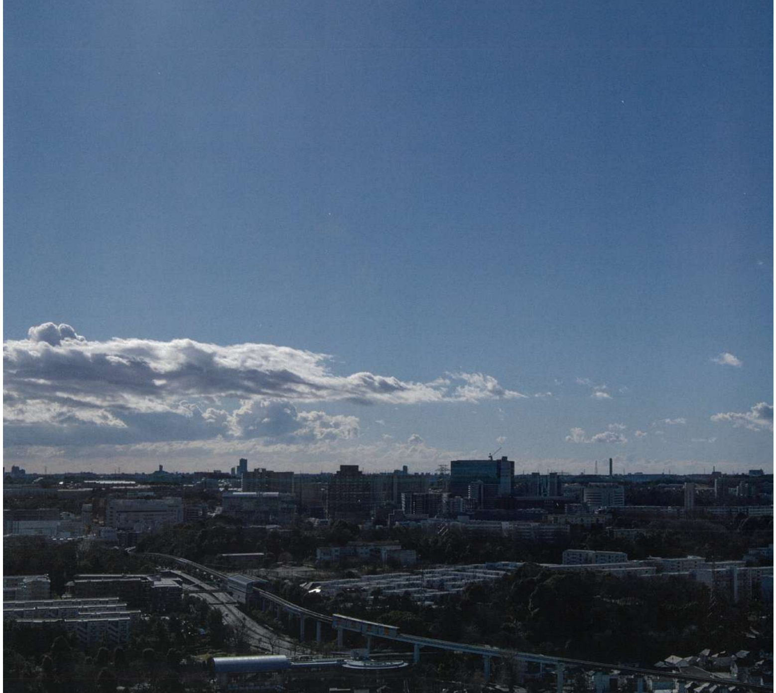
当大学から見た堀之内方面の眺め(2025年12月26日帝京大学八王子キャンパスにて撮影)